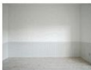
コンセプト空間 5 blanc

モダンに“和”を楽しみたい人へ。 土間と畳を組み合わせた 新しくつろぎスタイル。