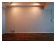
コンセプト空間 6 Wasabi

ロマンチックに“白”を愛でたい人へ。 白木の床から白い壁、コンクリオン白ペンキの 高い天井へと白がつつく優雅な乙女スタイル。