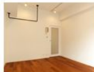
コンセプト空間 2 sozai

“カワイイ”をたいせつにする人へ。 ピンクと薔薇(ローズ)と シャンデリアを大胆にあしらった姫スタイル。