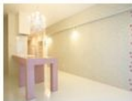
コンセプト空間 1 Rosa

“カワイイ”をたいせつにする人へ。 ピンクと薔薇(ローズ)と シャンデリアを大胆にあしらった姫スタイル。