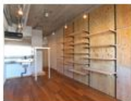
コンセプト空間 3 Rough

日常に“心地いい”を求める人へ。 有孔ボードの棚や床材、 壁紙など自然な素材感で和みスタイル。