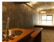
コンセプト空間 4 Doma

住空間にも“遊びゴコロ”が欲しい人へ。 DIYスペースで、釘打ちOK!ペイントOK! ラフな進化系スタイル。