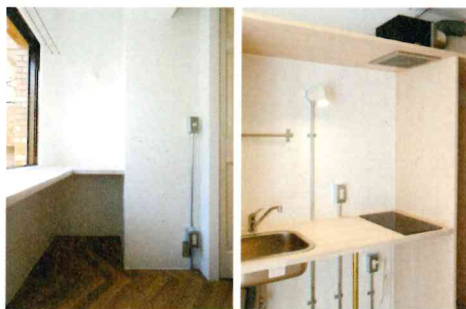
左・窓辺のカウンターでは、自然光の下で心地良く過ごせる。 右・シンプルなキッチン、支柱をゴールドにペイント。