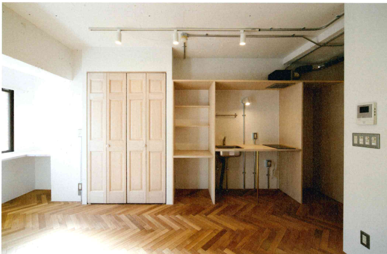
輸入建具やヘリンボーンの床など、装飾性豊かな内装。コンパクトなワンルームながら、優雅な気分で過ごせそう。

て、上質な空間にまとめ上げている。また、クローゼットとキッチンあいだには小さなデスク、窓際にはカウンターが装備され、家に持ち帰った仕事を片付けたり、読書をしたりするのに便利。ワンルームというと、ついベッドの上で過ごす時間が長くなりがちだが、ここならメリハリのある暮らしが楽しめる。